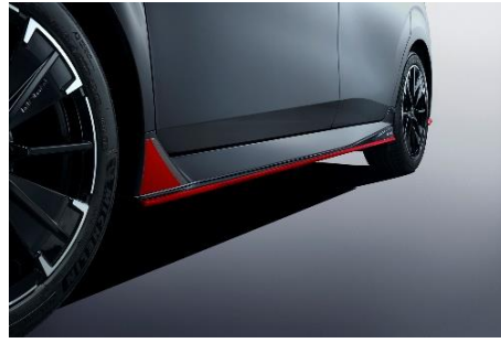
装着例(左サイドシル前部)