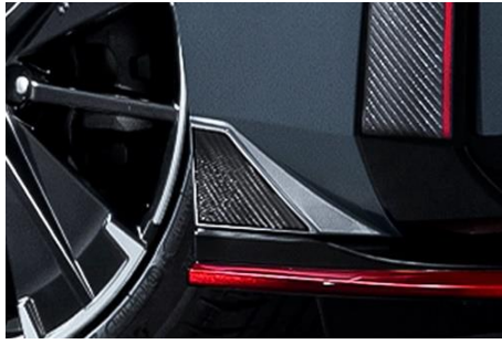
装着例(右フロントバンパーサイドロア部)