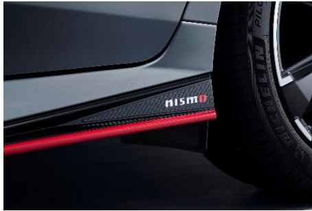
装着例(左サイドシル後部)