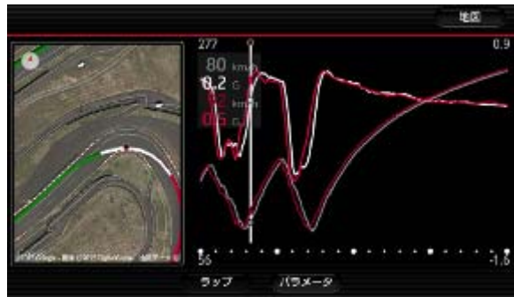
走行ライン図（コース画像）・車速・前後G表示例