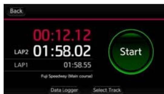
ラップタイム表示例

サーキット走行時に、スタート・フィニッシュラインを通過後、自動的にラップタイムを計測・表示します。スマートフォンのGPSより取得した位置情報を元に計測します。