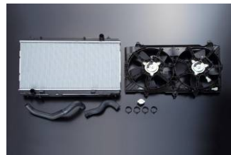
Z33用ラジエターキット

ニッサン・モータースポーツ・インターナショナル株式会社(本社:東京都品川区南大井 社長:宮谷正一、以下ニスモ)は、フェアレディZ(Z33、Z34)用の「クーリングメニュー」を設定し、NISMO大森ファクトリー、全国のNISMOエキスパートショップ、NISSAN GT-R特約サービス工場であるノバ・エンジニアリング株式会社およびノルドリンクを通じて7月14日より発売いたします。 ※リアデフオイルクーラーキットおよびキットメニュー商品は、8月4日より発売いたします。