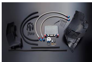
Z34用エンジンオイルクーラーキット