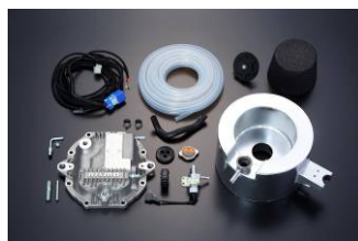
リアデフオイルクーラーキット