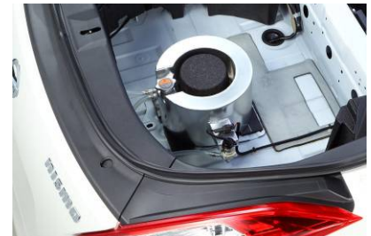
<ウォータータンク設置例>