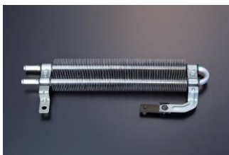
Z34用パワーステアリングオイルクーラーキット